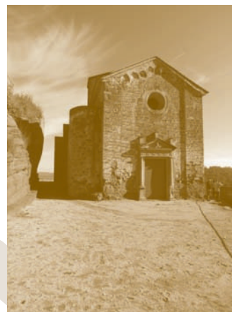
Sta. Maria de Cervelló