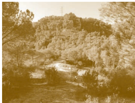
Collet Can Riera

Lliurament de la samarreta el dia de la sortida.